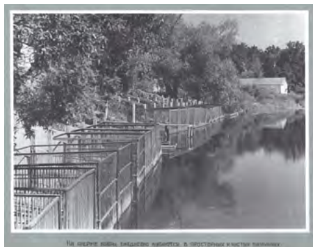
ЛАВРОВЫ ЗООЛОГИ. ОСНОВОПОЛОЖНИК РОДА

В соответствии с поставленной перед ООПТ (особо охраняемая природная территория) государственной задачей по сохранению и восстановлению запасов речного бобра, в 1932 году на Центральной усадьбе был создан экспериментальный бобровый питомник. Бобровая ферма (как первоначально назывался питомник) долгие годы была базой передержки диких зверей, здесь комплектовались пары и подготавливались партии на расселение. Существование бобрпитомника неразрывно связано с династией Лавровых. Здесь они многое делали впервые.